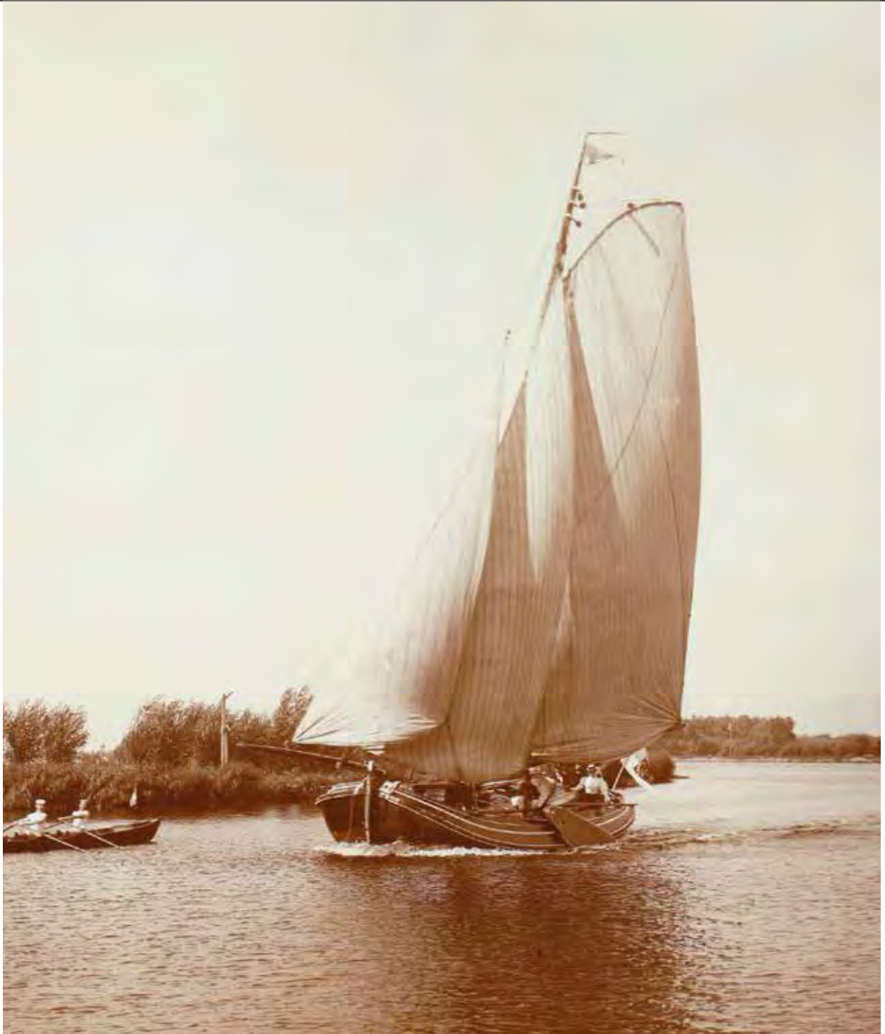
'Ludana op de Amstel'. De foto komt uit de boedel van de werf Bernhard in Nieuwendam. Het betreft een originele 22x28 afdruk van fotograaf Elfrinkhoff. Bron: ssrp.nl