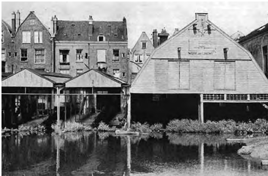
De Bernhard-werf 'Het Jacht' aan de Looijerssloot kort na de Tweede Wereldoorlog. De werf is dan al weg, maar de naam staat nog op de gevel.