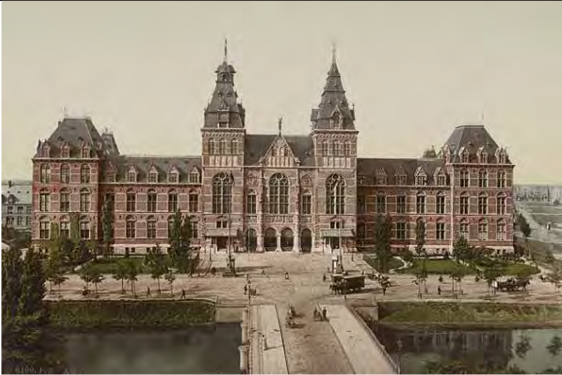
Amsterdam in de steigers eind negentiende eeuw: het Rijksmuseum verschijnt aan de rand van de stad.