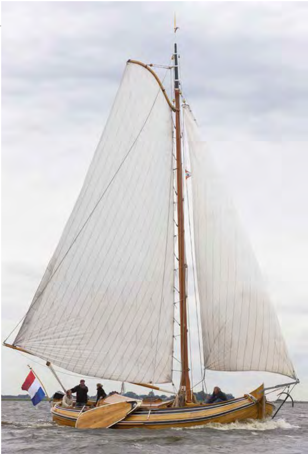
Foto bij artikel 'Boeier Ludana - Overtuigd van zichzelf', Waterkampioen, december 2013.